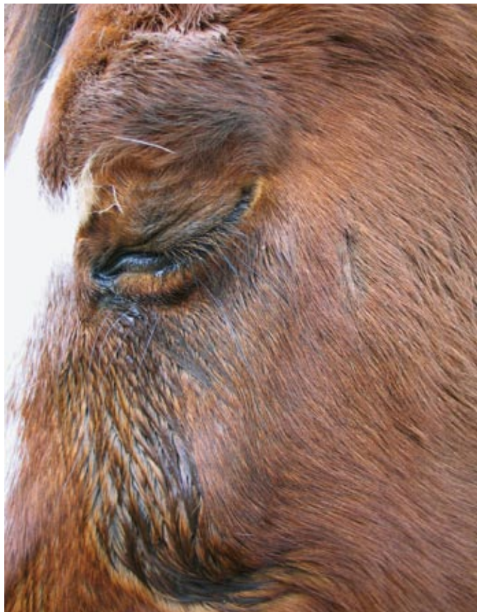
Der 15-jährige Wallach litt vor der Kur mit dem Detox-Produkt an einer wiederkehrenden Augenentzündung.

Schock bei den Tieren aus“, ist ihre Beobachtung. Im letzten Jahr hat sie mehrere Pferde, die zur Regulation, also zur Heilung nach der Behandlung, nicht mehr fähig waren, mit Produkten aus der Biologo-Detox-Linie (siehe Kasten) behandelt. „Durch die Erfahrungen mit anderen Entgiftungs-Systemen vorsichtig geworden, habe ich überall mit dem reinen Gift-Binder Biologo-Rescue begonnen, wodurch nur die täglich aufgenommenen Belastungen ausgeleitet werden“. Alleine das reicht oft schon aus, um erstaunliche Effekte zu erzielen: Im Falle eines 15-jährigen Wallachs, der bereits seit rund eineinhalb Jahren unter einer wiederkehrenden Augenentzündung gelitten hatte, reichte eine einmalige Kur von Biologo-Rescue in der Dosierung aus dem Humanbereich, dass sich das Auge durch die darauf folgende homöopathische Behandlung dauerhaft erholte. Das war vorher weder durch schulmedizinische Behandlung, noch mit Homöopathie oder Akupunktur zu erreichen gewesen. Das Beispiel eines 16-jährigen Wallachs mit diversen chronischen Prozessen – von Hautproblemen bis Husten – zeigt die Wirkungsweise des Ausleitens freier Gifte: Das Tier leidet seit seinem zehnten Lebensjahr an einer bakteriellen Hautinfektion. Nach einer offensichtlichen Unterdrückung folgten asthmatische Hustenanfälle.