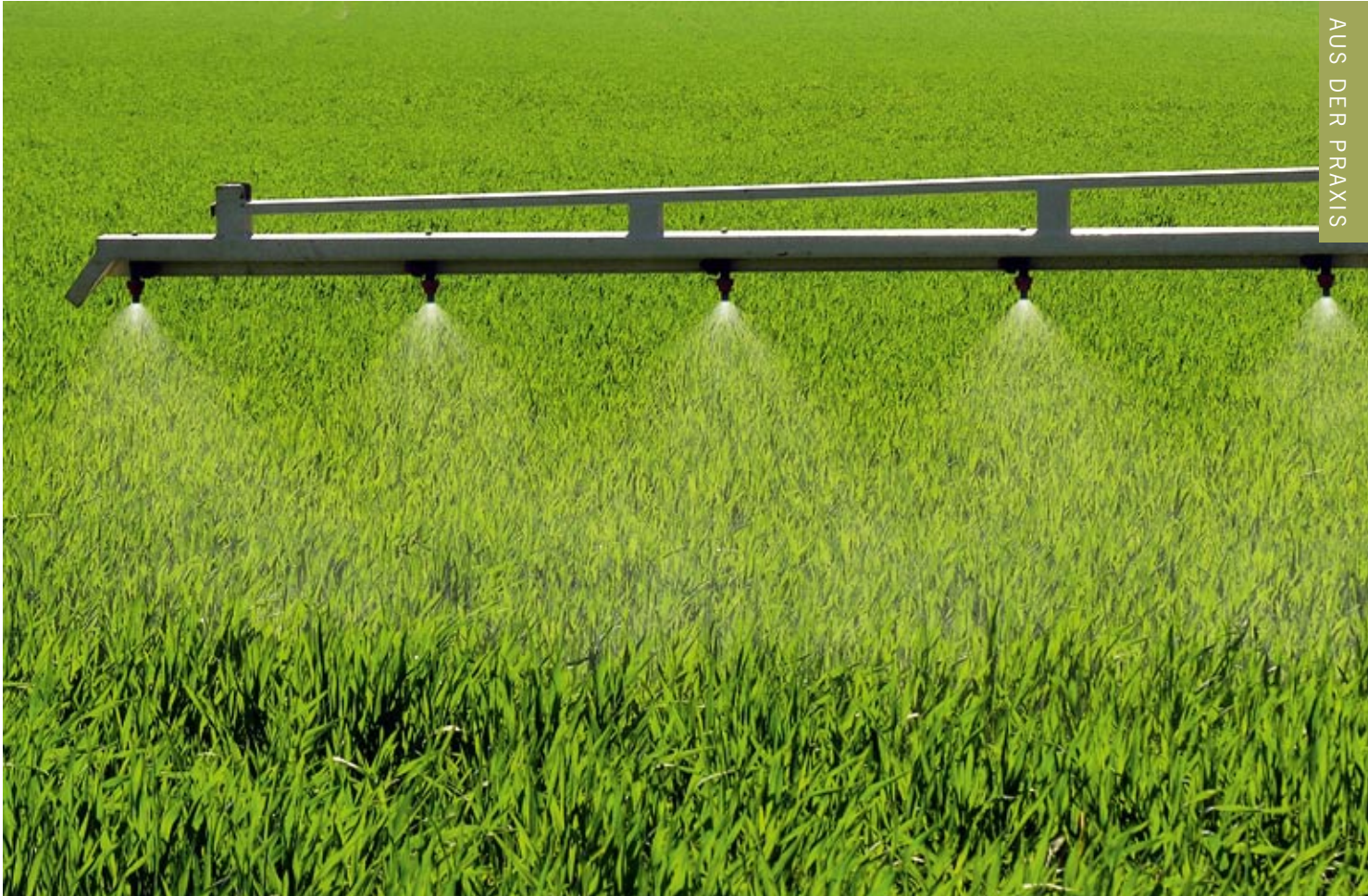
Nicht nur Pflanzenschutzmittel belasten die Nahrung unserer Tiere.

Auffälligste Symptome sind Strahlfäule an einem der Hinterhufe, die schon vor der Hautinfektion bestand, und eine offene Stelle am Sprunggelenk desselben Beins. Zwei Tage nach dem Beginn einer Kur mit Biologo-Rescue schloss sich die offene Stelle,