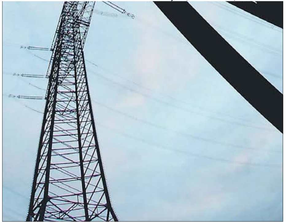
Jahrzehntlang wurden Hochspannungsmasten mit Bleimennige gestrichen, um sie vor Rost zu schützen.