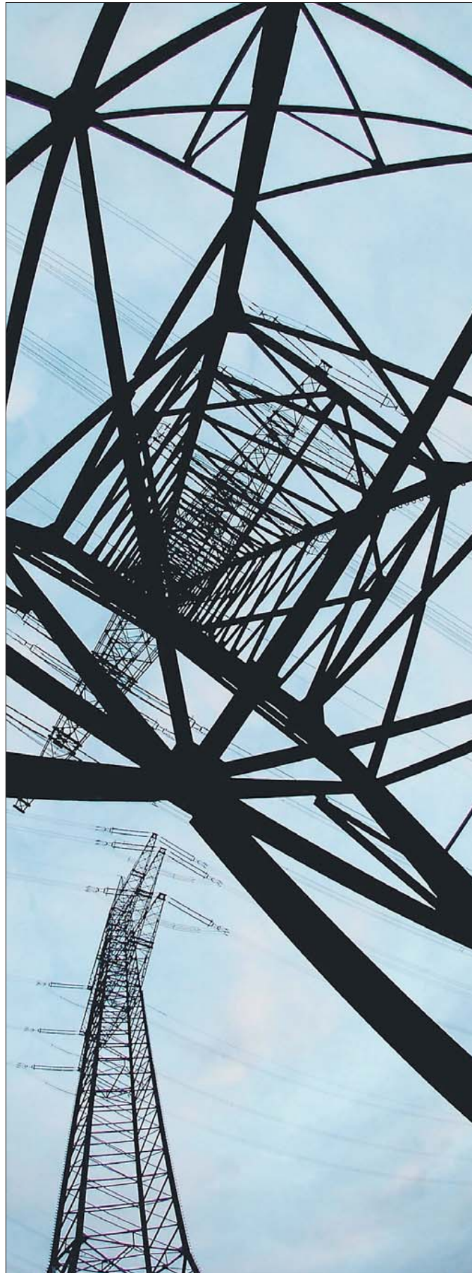
Jahrzehntelang wurden Hochspannungsmasten mit Bleimennige gestrichen, um sie vor Rost zu schützen.

Nun steht wohl kaum ein Höchstspannungsmast auf einem Kinderspielplatz. „Aber Kinder spielen ja auch in Hausgärten oder in Kleingartenanlagen. Hier gibt es durchaus solche Masten und damit die Gefahr, dass Kinder Blei aus dem Boden aufnehmen“, sagt Ingo Valentin. Die systematische Erfassung von Masten an solchen sensiblen Standorten gehört